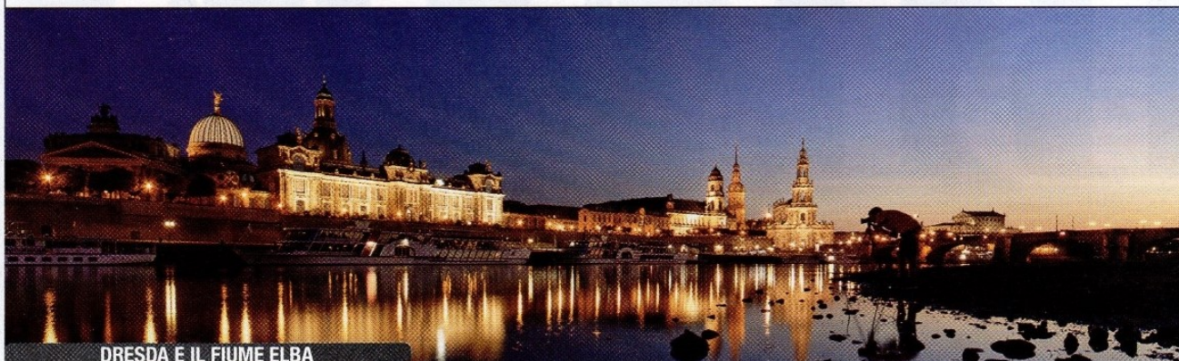
DRESDA E IL FIUME ELBA